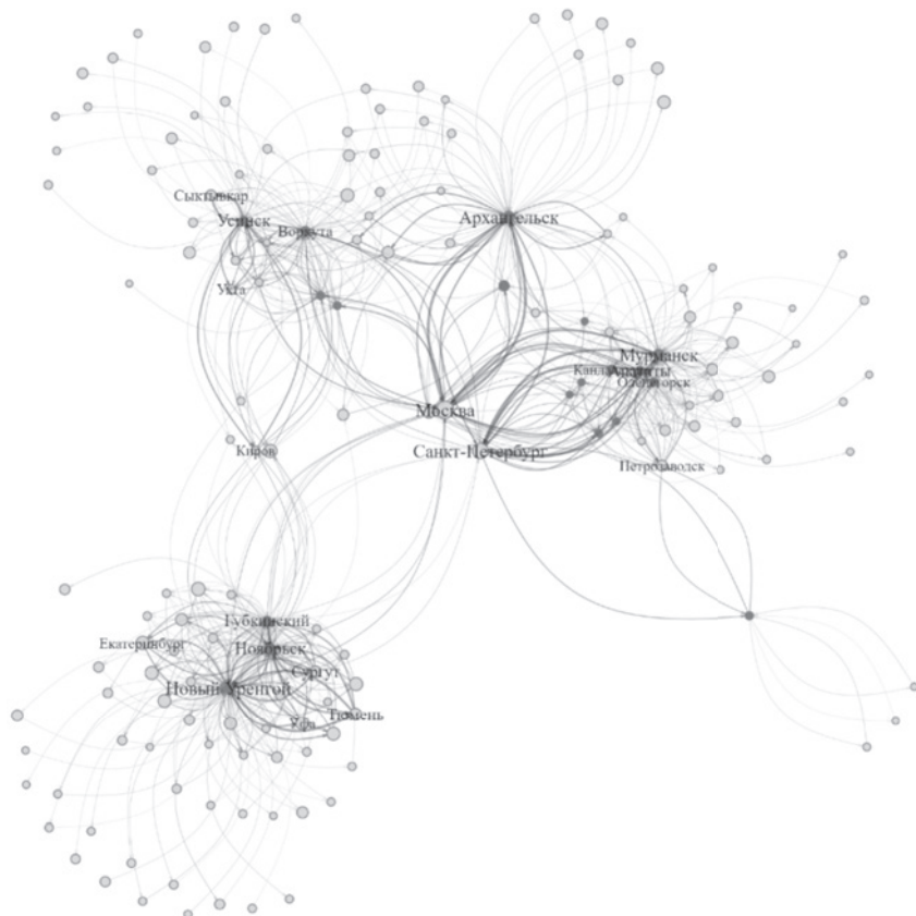
Рис. 2. Сеть железнодорожных перемещений в российской Арктике (составлено по данным «Туту.ру»)

В авиационной сети 15 % перелетов совершаются из Москвы, а еще 18 % — в Москву. Таким образом, на столицу приходится треть от всех перемещений. Помимо Москвы есть еще несколько крупных хабов: Мурманск (25 %), Новый Уренгой (23 %), Санкт-Петербург и Архангельск (по 17 %). Крупнейшие потоки — между Мурманском и Москвой, а также между Санкт-Петербургом и Архангельском. Алгоритм выделил в сети всего один кластер — большинство аэропортов связано с несколькими крупными хабами одновременно (рис. 1).